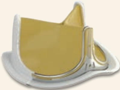
INSPIRIS RESILIA Aortic Valve

For professional use. See instructions for use for full prescribing information, including indications, contraindications, warnings, precautions, and adverse events.