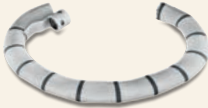
Edwards Cardioband Mitral Repair System